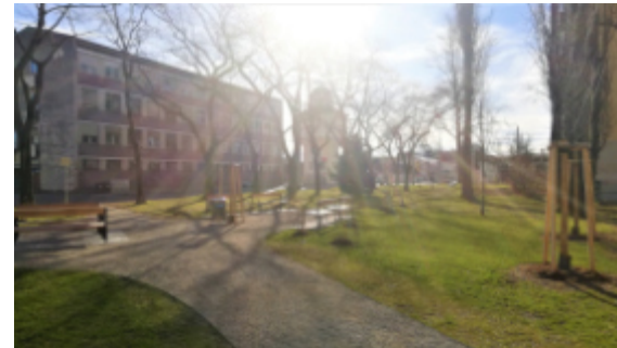
Neu gestalteter Wasserturmpark

“Beim Stadtteilzentrum treffen wir uns zum Spielen, Reden und Garteln, einmal hat mir sogar ein Nachbar meinen Radlpatches gerichtet. Und wenn ich Hilfe bei der Bürokratie oder am Computer brauche, kann ich immer kommen” - erzählt eine Besucherin. Gemeinsam geht alles leichter, und das Stadtteilzentrum ist ein Ort für Begegnung und gegenseitige Unterstützung.