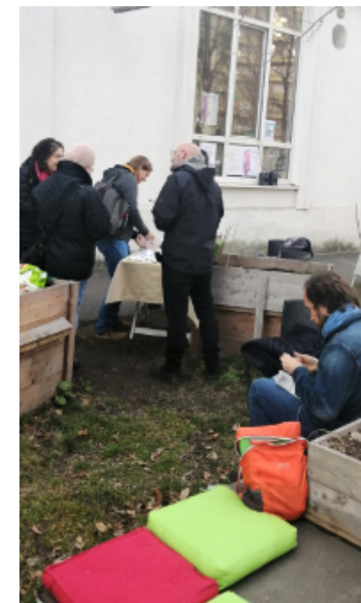
Saatguttausch im STZ

Frauen für ein wunderschönes Stück Natur in Eggenberg. Es handelt sich um ein Kooperations-Forschungsprojekt mit dem IFZ und dem Zentralgartenbüro. Regelmäßiges Mitmachen ist erwünscht. Freitag am Nachmittag ist gemeinsamer Gartentag! Ab Herbst wird die Gruppe dann geöffnet und erweitert.