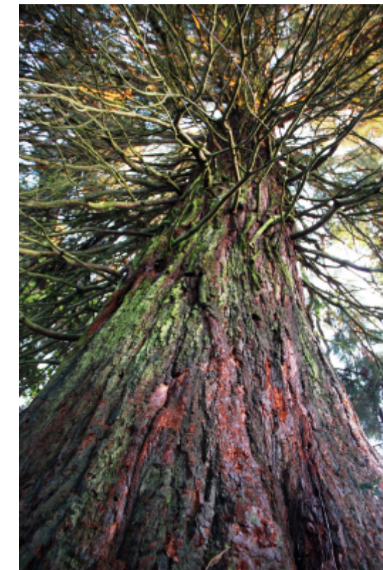
Mammutbaum beim Grazer Urwald

Treffpunkt St. Peter – der Name ist Programm. Mittwochs findet bei uns die Senior:innen Café statt, bei dem sich die Nachbarschaft besser kennenlernt und zusammenwächst. Gesprochen wird über Tagesaktuelles und alle Themen des Lebens. Nicht nur für Senior:innen, sondern für Jung und Alt sind die Sprechstundenzeiten da, bei denen alle Anliegen willkommen sind. Kommt auf Kaffee oder Tee zum offenen Treffen. Auch das wöchentliche Angebot Eltern-Kind-Café startet durch und freut sich über weitere Teilnehmer:innen, Eltern, Großeltern und Menschen mit Kindern. Die Türen des Nachbarschaftszentrums stehen weiterhin für individuelle nachbarschaftliche Raumnutzungen offen!