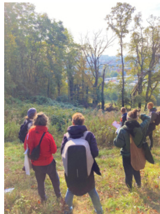
Gartengrundstück Gemeinschaftsgarten EggenLend

Für alle die gern in einem größeren Rahmen gärtnern und einen richtigen Gemeinschaftsgarten aufbauen wollen: Wir suchen eine Gruppe Garten-interessierter