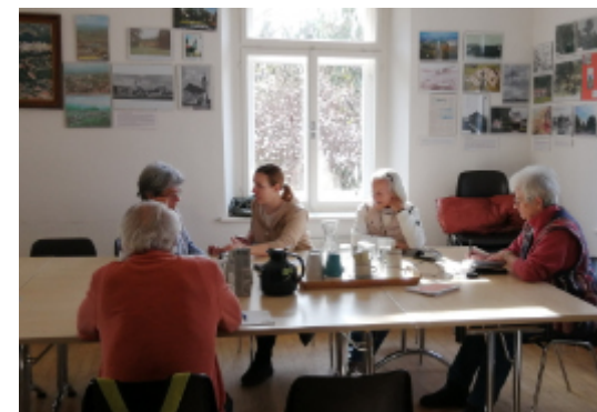
DIGIcafé im NBZ St.Peter

"Ach so geht das, das ist ja ganz einfach, danke für die Unterstützung!" So und ähnlich die Rückmeldungen zum beliebten monatlichen Digicafé, wo alle Fragen zu technischen Geräten beantwortet werden! In angenehmer Runde und mit selbst mitgebrachtem Handy, Tablet, Laptop geht es gemeinsam viel einfacher. Der erste Termin des Jahres war bereits gut besucht, weiter geht es Mittwoch, 4. April 2024 von 10 bis 12 Uhr und Mittwoch, 8. Mai 2024 von 10 bis 12 Uhr.