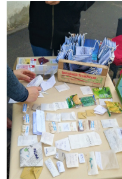
Saatguttausch im STZ