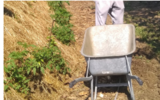
Gemeinschaftsgarten Santa Garterina

Der Gemeinschaftsgarten St.Peter „Santa Garterina“ im ORF-Park startet wieder die neue Saison. Wer mitmachen möchte, helfende Hände und nette Menschen aus der Nachbarschaft sind immer willkommen!