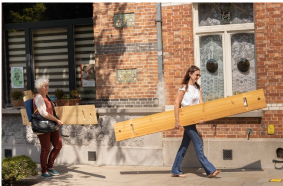
Bench Invasion: © La Strada

https://www.lastrada-anmeldung.at/benchinvasion/