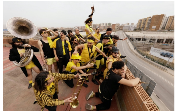
ADMB Brass Band

Wir wünschen allen Andritzer*innen einen schönen, erholsamen Sommer und melden uns wieder zu Schulbeginn!